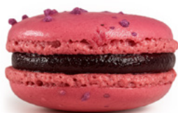
9. Czarna porzeczka