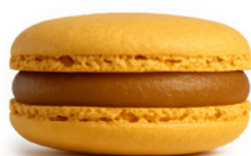
7. Słony karmel